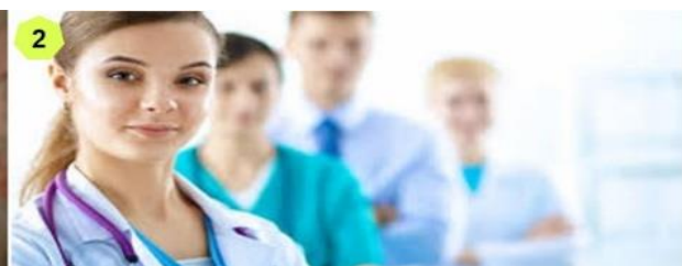
2 Samen aan het werk