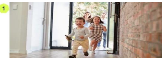
1 Thuis bij onze cliënt