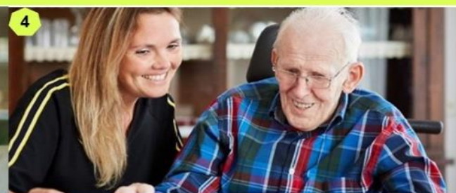
4 Goed in wat je doet