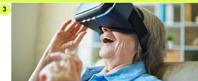
3 Actief in duurzame innovatie